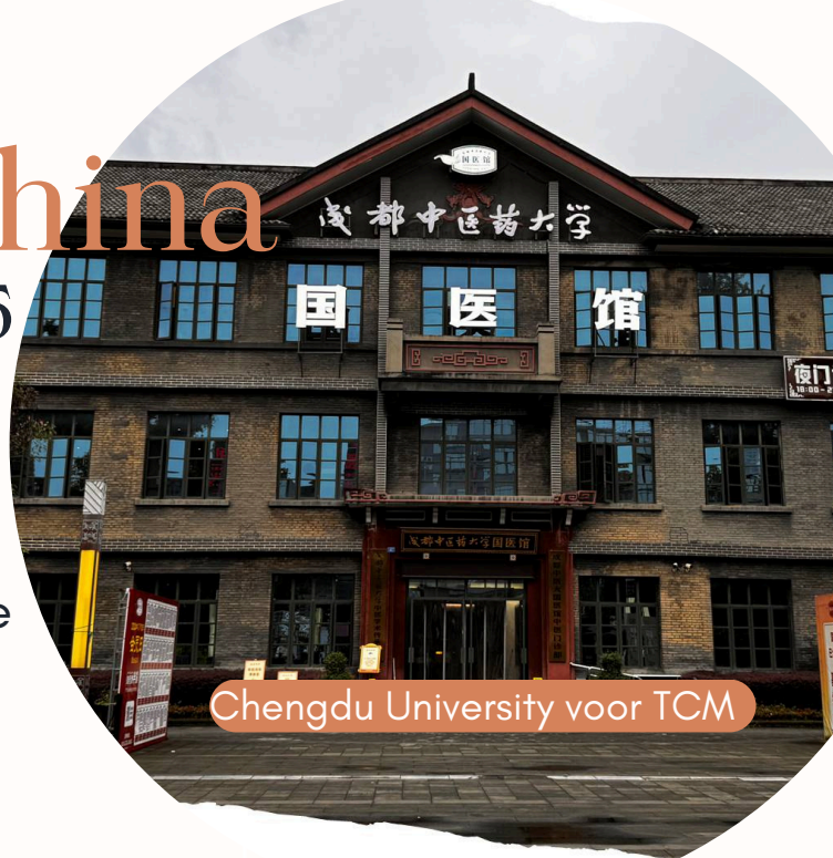
Chengdu University voor TCM

Ga mee op een 14 daagse trip naar China waarbij er 10 ochtenden stage worden gelopen in het Chengdu Universiteitsziekenhuis en 4 middagen theorielessen zullen zijn.